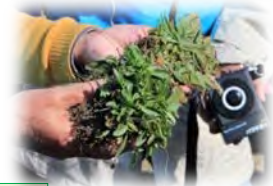
オオキンケイギクと ヘラオオバコ（右奥）

9. 2017年3月12日 (7,000株 93kg) 第16回お掃除会 (80名)