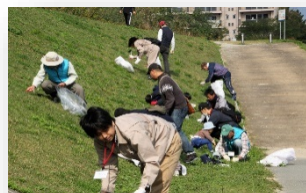
武庫川本川の田近野付近 オオキンケイギクと ヘラオオバコを駆除