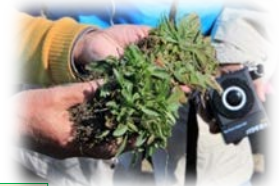
オオキンケイギクと ヘラオオバコ（右奥）

9. 2017年3月12日 (7,000株 93kg) 第16回お掃除会 (80名)